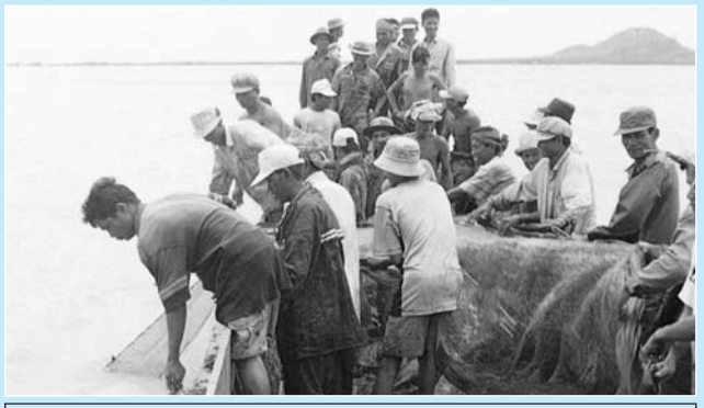
សហគមន៍ជាច្រើនមានការអាក់អន់ចិត្តខ្លាំងឡើងៗដោយសារជម្លោះ ដ៏ខ្លាំងក្លានិងកង្វះដំណោះស្រាយលើបញ្ហានេសាទ។ ជាញឹកញាប់, សហគមន៍មួយចំនួនបានសម្រេចដោះស្រាយបញ្ហាដោយផ្ទាល់ដៃ ខ្លួនឯង។ ឧទាហរណ៍ការរឹបអូសឧបករណ៍នេសាទខុសច្បាប់ដូចដែល បានបង្ហាញតាមរយៈរូបភាពខាងលើដែលកើតឡើងក្នុងខេត្តតាកែវ។

នៅមុនពេលដែលអង្គការមិនមែនរដ្ឋាភិបាលចាប់ ផ្តើមធ្វើការសិក្សាទៅលើបញ្ហាជលផល សហគមន៍នេសាទ ដែលទទួលបាននូវការប៉ះពាល់ធ្ងន់ធ្ងរបានប្រើប្រាស់វិធីសាស្ត្រ របស់គេរួចទៅហើយនៅក្នុងការដាក់ការគាបសង្កត់ទៅលើ រដ្ឋាភិបាល។ ខុទ្ទកាល័យរបស់នាយករដ្ឋមន្ត្រី គឺជាគោលដៅ នៃលិខិតដែលប្រកបដោយការខឹងសម្បាររបស់សហគមន៍ ការធ្វើបាតុកម្មនៅមុខរដ្ឋសភាជាតិ និងការគាបសង្កត់ពី អន្តរការីនៅក្នុងខុទ្ទកាល័យនាយករដ្ឋមន្ត្រី។ ទោះបីជាវិធី ធ្វើការតស៊ូមតិបែបនេះពិតជាចេញមកពីបំណងពិតប្រាកដ នៅក្នុងការគាបសង្កត់ទៅលើរដ្ឋាភិបាលក្តី តែគេពិបាកនឹង វាស់វែងបានពីប្រសិទ្ធភាពរបស់វាណាស់។ អ្នកខ្លះមានការ សង្ស័យថា បច្ចេកទេសទាំងនេះមានប្រយោជន៍ណាស់នៅ