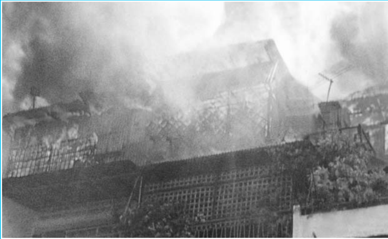
ខាងឆ្វេង : ការខូចខាតដោយអគ្គិភ័យនៅថ្ងៃទី ២៦ ខែ មីនា ឆ្នាំ ២០០២ នៅប្រាក់តាន់ប៉ា