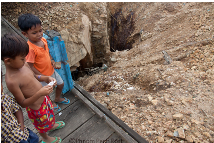
ក្រុមកុមារ កំពុងដើរលេងនៅលើស្ពានមួយនៅ ពីលើអណ្តូងដីជ្រៅ ដែលមានទីតាំងស្ថិតនៅខេត្ត មណ្ឌលគិរី Don Weiland

Fri, 4 January 2013 ម៉ៃ គុណមករា and Sarah Thust